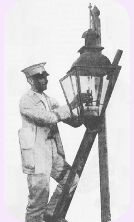
Encendiendo un farol.

A medida que fueron apareciendo nuevos inventos (electrodomésticos) la energía eléctrica se fue difundiendo como fenómeno novedoso en la sociedad. En un principio, solo las clases sociales altas podían hacer uso de este servicio. Estas residían en zonas próximas a las usinas generadoras y se vinculaban entre sí por medio de líneas eléctricas precarias. Para que “la luz” pudiera llegar a nuevos usuarios fue necesario expandir las redes eléctricas desde centrales cada vez más potentes e instaladas en zonas alejadas de la demanda. Con el paso del tiempo y el desarrollo tecnológico del equipamiento eléctrico, los pequeños sistemas aislados, compuestos por motogeneradores y líneas de distribución eléctrica de corta distancia, pasaron a interconectarse y unir grandes centrales generadoras en el interior del país, con redes de demanda eléctrica cada vez más grandes. Actualmente, el sistema eléctrico puede dividirse en tres partes: generación (las centrales que producen energía eléctrica), transmisión (las redes que transmiten electricidad de alta tensión a grandes distancias) y distribución (que suministran la energía eléctrica a cada usuario final, ya sea hogar o industria).